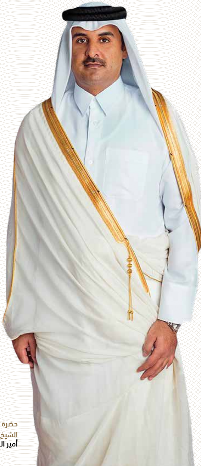
حضرة صاحب السمو الشيخ تميم بن حمد آل ثاني أمير البلاد المفدى