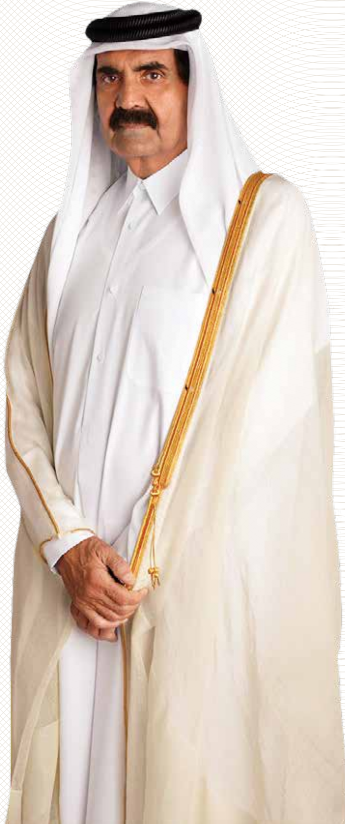
صاحب السمو الشيخ حمد بن خليفة آل ثاني الأمير الوالد